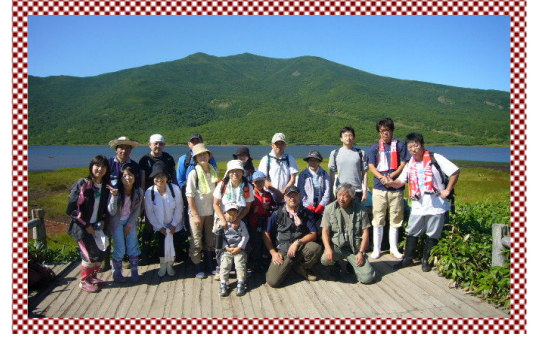
<羅臼湖トレッキングにて>

らいず事業については、企画する委員さん達が参加者にとって楽しく、参加しやすいものを！と、会議を開催するたびに会場の借用時間だけでは足りないくらいの議論を行いました。その結果、開催するたびに沢山の参加者に恵まれ、良いスタートを切れた年だったと思います。来年度も楽しい事業を企画してくれそうですので、みなさん、楽しみにしてくださいね！ (広報部会：T)